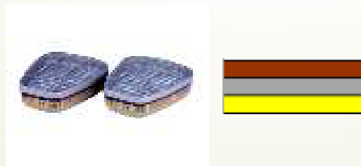
3M 6057- ABE1