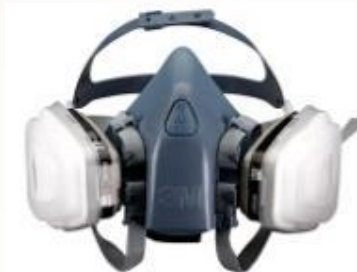
3M 7501- S 3M 7502- M 3M 7503- L