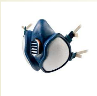
3M 4277- FFABE1P3 R D