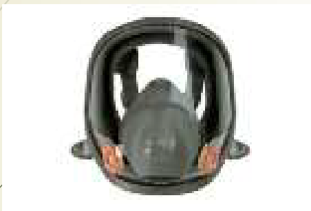
3M 6700- S 3M 6800- M 3M 6900- L