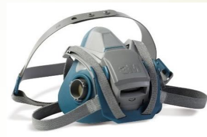
3M 6501- S 3M 6502- M 3M 6503- L