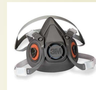
3M 6100- S 3M 6200- M 3M 6300- L